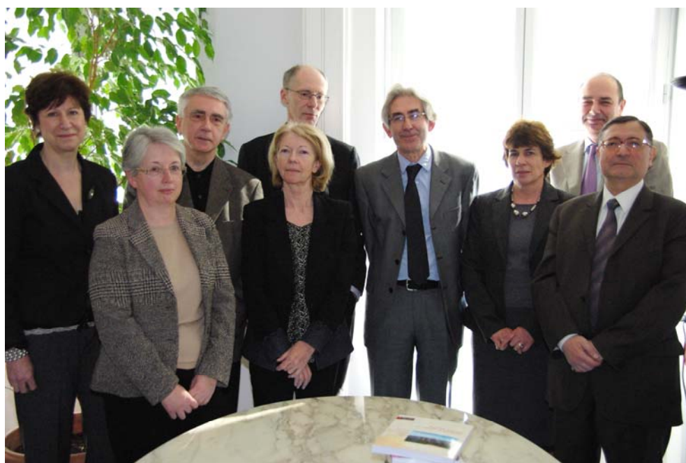
Cliché Corinne Tournier